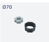
RO.60 OT70 Kit adattatori ottagonali. Octagonal adapters kit.