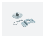
RO.0552 Perno quadro 16 mm con staffa omega per manovra di soccorso. Pin for 16 mm square with omega bracket for backup operating system.