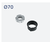
RO.60 TO70 Kit adattatori tondi. Round adapters kit.