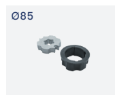
RO.60 OG85 Kit adattatori ogiva. Ogive adapters kit.