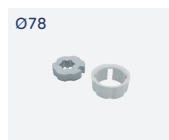
RO.60 OG78 Kit adattatori ogiva. Ogive adapters kit.