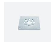
RO.0568 Piastra 100x100 mm. 100x100 mm plate.